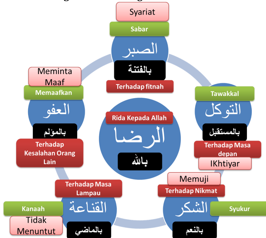
Bagan 3. Rida sebagai Variabel Sentral

Skema di atas menunjukkan beberapa variabel yang bersentral pada rida, antara lain: sabar, tawakal, syukur, kanaah, dan kemaafan. Semua variabel tersebut menjadikan rida sebagai dimensi sentral dengan fitur yang berbeda-beda. Kelima variabel tersebut juga membutuhkan dimensi tambahan untuk menjadikan variabel baru yang lebih utuh. Syukur membutuhkan dimensi eksternal berupa ekspresi bersyukur dalam bentuk pujian atau ketaatan. Sabar butuh dimensi tambahan berupa persistensi dalam ketaatan. Tawakal butuh dimensi tambahan berupa usaha untuk masa depan. Kanaah membutuhkan variabel tambahan dalam bentuk perilaku tidak menuntut dunia. Kemaafan membutuhkan variabel tambahan berupa meminta maaf kepada orang lain dan meminta ampunan kepada Allah.